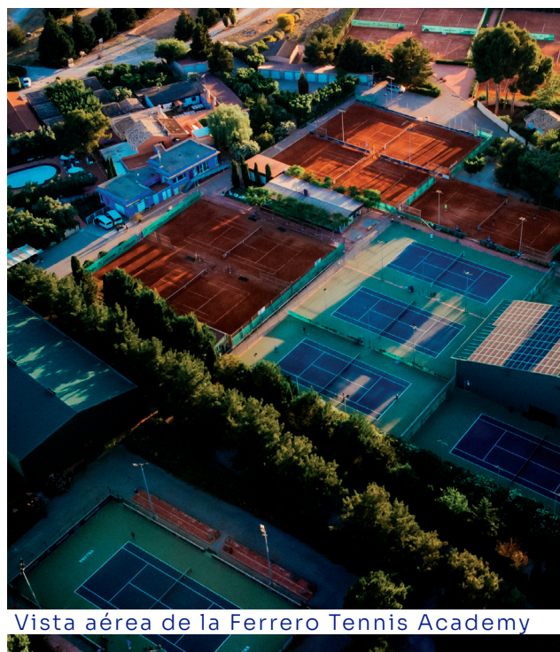
Vista aérea de la Ferrero Tennis Academy