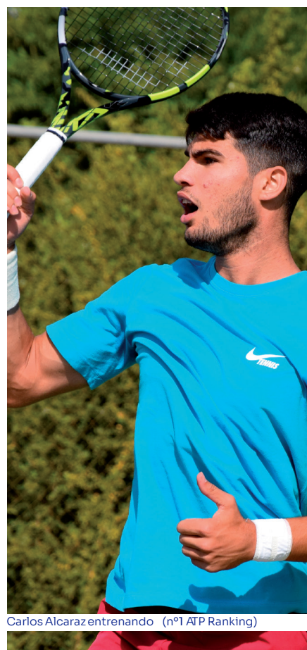
Carlos Alcaraz entrenando (nº1 ATP Ranking)