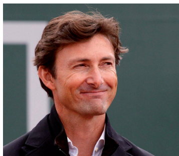
Juan Carlos Ferrero nº1 ATP Ranking

“Ven al lugar donde entrené tantos años hasta alcanzar el nº1 del mundo, y donde resido ahora con mi familia. Mi Staff y yo ayudamos personalmente a los jugadores a lograr sus objetivos.”