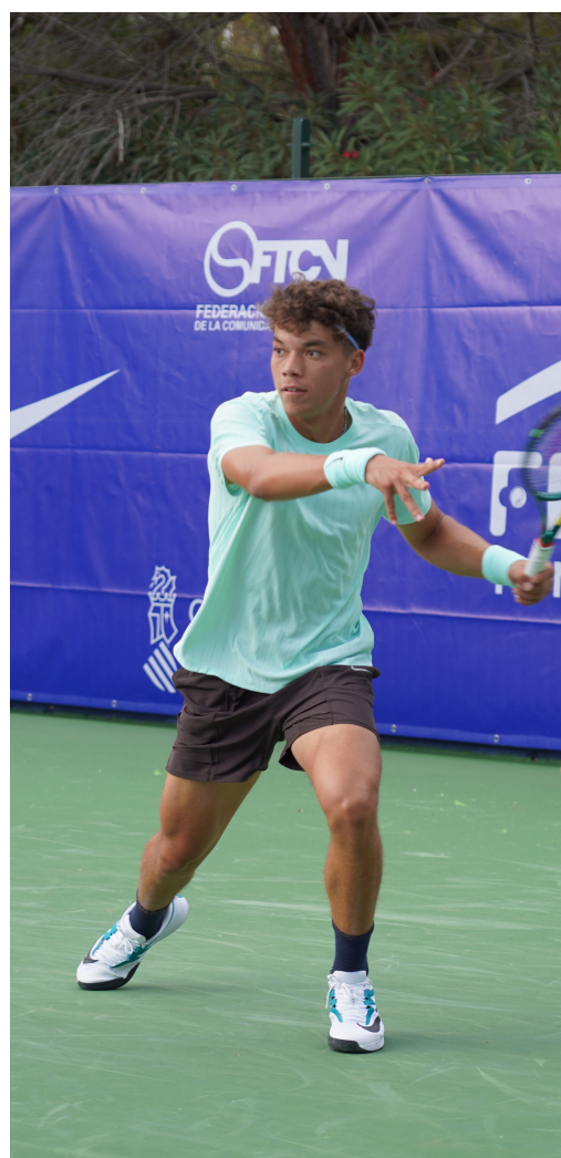
Darwin Blanch en el torneo ATP Alicante Ferrero Challenger 2025