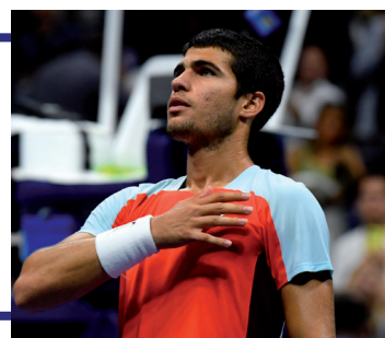
Carlos Alcaraz nº1 ATP Ranking

“En Ferrero me considero uno más de la Academia y eso me hace estar más enfocado en mi trabajo, que es el tenis. El trato hacia los jugadores es único. te hacen sentir parte de una gran familia.”