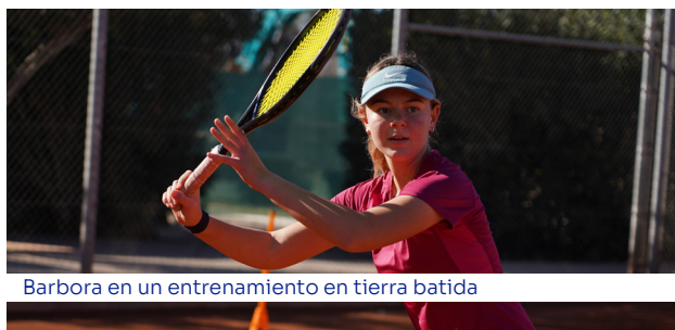
Barbora en un entrenamiento en tierra batida