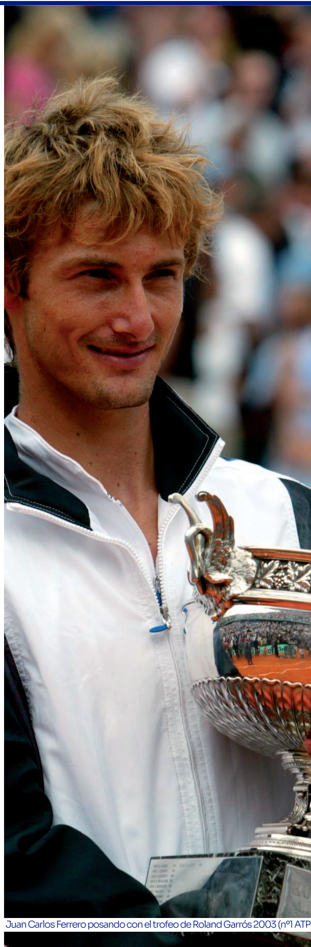
Juan Carlos Ferrero posando con el trofeo de Roland Garrós 2003 (nº1 ATP)

La segunda es el ambiente familiar que nos caracteriza desde hace 30 años. Nos sentimos orgulloso de presentar la Academia como una gran familia en la que trabajadores y jugadores conviven y aprenden juntos.