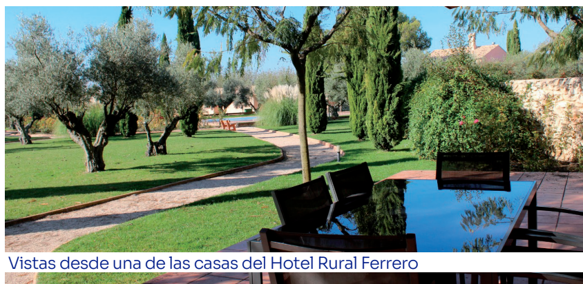
Vistas desde una de las casas del Hotel Rural Ferrero