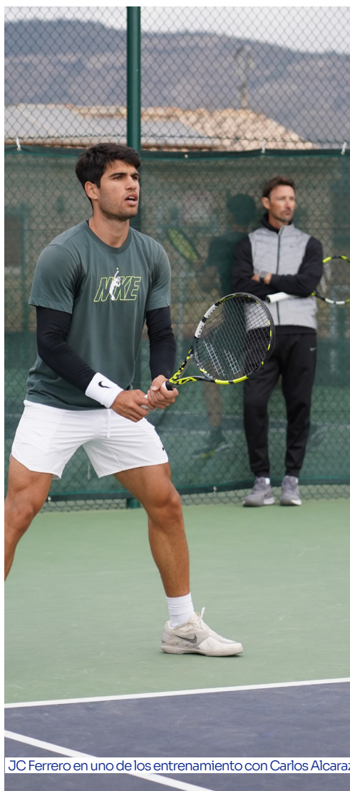
JC Ferrero en uno de los entrenamientos con Carlos Alcaraz

** Por legislación Española no podemos organizar recogidas en la Estación de tren de Alicante