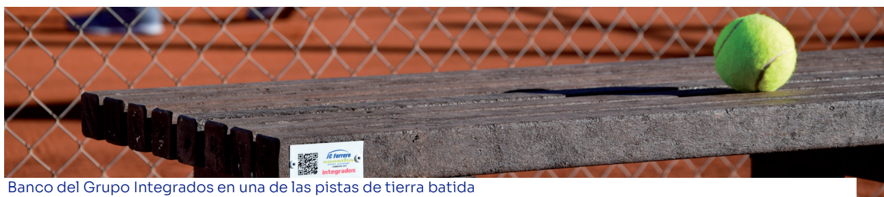
Banco del Grupo Integrados en una de las pistas de tierra batida

Ferrero colabora con Caritas y otras ONG's para ayudar a personas más desfavorecidas mediante la donación de indumentaria.