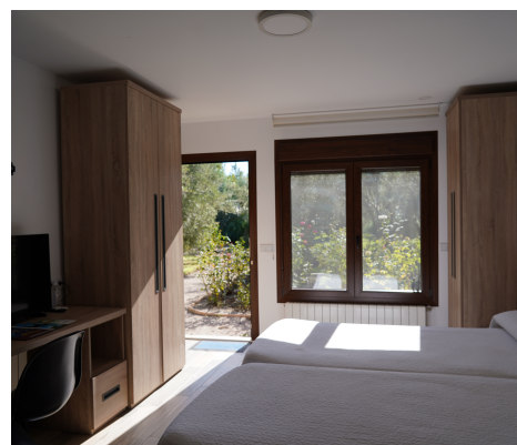
Interior de una de las casas de madera del Hotel Rural Ferrero

A 30 minutos de las mejores playas de la Comunidad Valenciana.