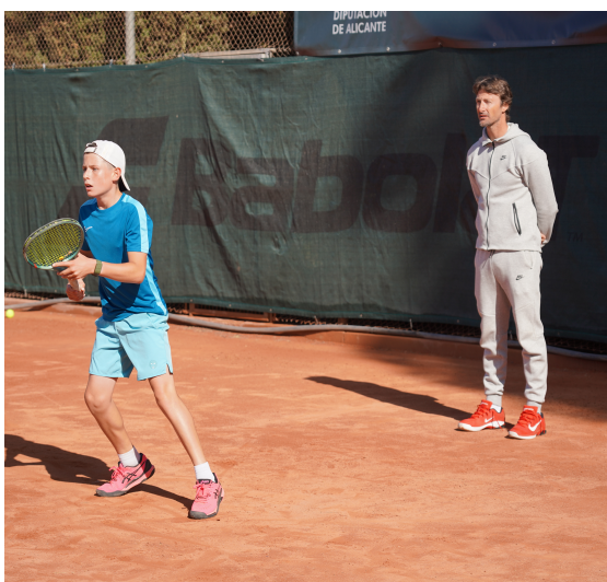
Juan Carlos Ferrero entrenando en la Academia 2025