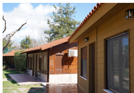
Exterior de una de las casas de madera del Hotel Rural Ferrero